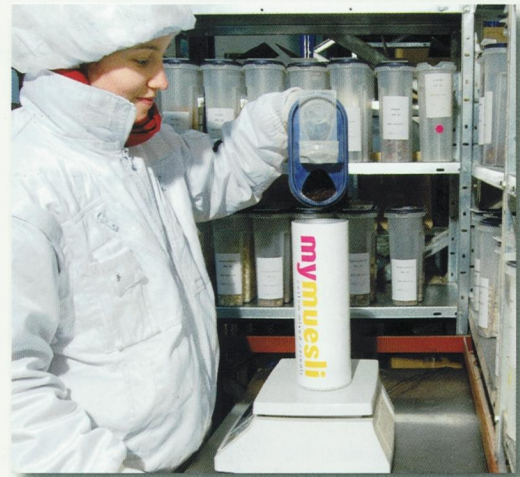
Müslimischung nach Wunsch

mymuesli war geboren und ging am 30. April 2007 online. Zwei Wochen später war bereits alles ausverkauft. Seither gehen immer mehr Bestellungen ein, und im